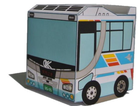
2013年式 日野セレガ ハイデッカ

車両解説 2013年に導入された日野製の最新車両。 衝突被害軽減ブレーキシステムなど最新 の安全装備を搭載しています。 大阪空港・関西空港と関西主要都市を 結ぶ路線で活躍しています。